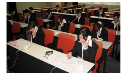
ビジネスマナー講座