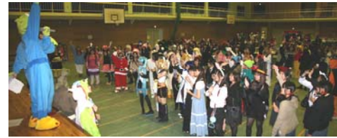
大学祭・前夜祭(仮装パーティー)

高等学校を卒業して入学する学生の割合が多いですが、有職者特別入試で入学する学生も含めて、様々な年齢・職業の学生が在学しています。