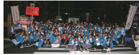
おはら祭りへの参加(県短連)

毎年、学生が主体となった様々な活動が行われ、これらの活動を通し地域の人々とも交流しています。第一部・第二部の自治会が合同で企画する新入生歓迎合宿、春・秋の体育祭、大学祭、文化祭、体育系・文化系のサークル活動など、多様な課外活動が行われています。